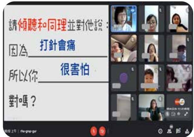
7/31因疫情在家使親子衝突增加，本會辦理線上「新移民心學習」親子講座教導家長如何和青少年溝通。