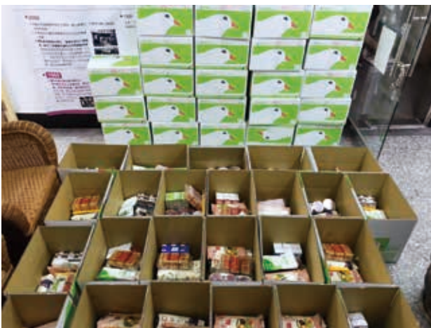
社工裝箱各界物資準備寄給家庭。