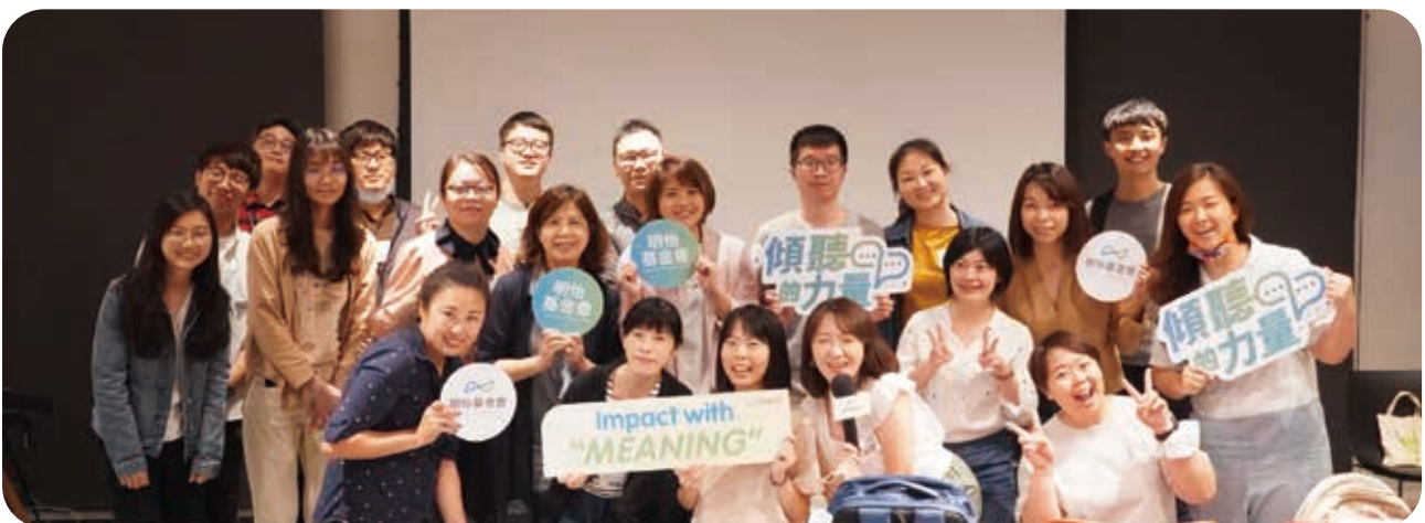
本會與其他6個組織獲選明怡基金會「傾聽的力量」專案，於2-5月間進行「服務使用者回饋系統(Beneficiary Feedback System)」研究，以優化服務。