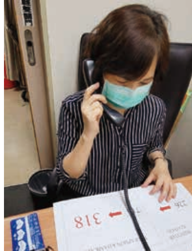
通譯人員透過電話諮詢、文字翻譯等持續提供服務。

而在防疫旅館隔離的外籍人士，無法用英語溝通時，通譯人員也發揮最即時的協助，到防疫旅館協助現場工作人員轉達隔離期間須遵守的規定，以及房間清潔與換房等相關注意事項。此外，當有移工須居家隔離或快篩時，健康服務中心的工作人員因語言不通而無法提供協助，此時通譯人員便直接進到健康中心協助完成電話疫調，並在現場提供翻譯服務工作，好讓防疫工作可以順利完成。