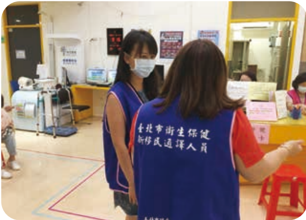
本年度新進通譯人員於中正區健康中心見習。