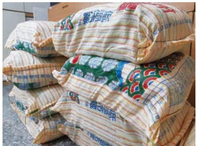
社會大眾捐助的糧食。