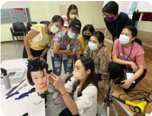
聯合勸募協會補助計畫「愛的剪刀手-基礎美髮培力工作坊」原為實體授課(左圖)，後因疫情改為線上教學(右圖)，媽媽們仍持續認真學習，努力培養剪髮技能，希望將來能透過一技之長嘗試不一樣的工作。