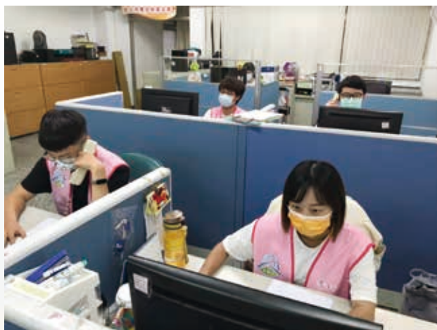
社工於疫情期間持續提供遠端服務，提供即時的防疫資訊給扶助家庭。

我國去年疫情控制還不錯，但到今年五月中旬起疫情變得很嚴重，對我們基金會來說，也遇到很大的衝擊。一方面，因為慷慨贊助我們的部分認養人收入受到影響，導致停止捐助；另一方面，我們服務的新移民，他們多從事居家清潔打掃、餐飲業、臨時工等工作，因為疫情的關係，導致失業或收入頓減。而我們的社工因為防疫需求，被迫暫停家訪、實體活動，不僅需調整工作型態，更要加緊提供防疫須知、物資等協助，幫助服務家庭安然度過疫情。整體而言，現今基金會所受捐助變少，但需要本會的服務需求卻大增，這些都再再對本會的服務造成衝擊。